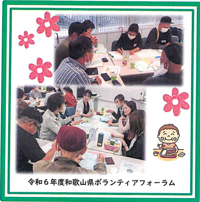
令和6年度和歌山県ボランティアフォーラム