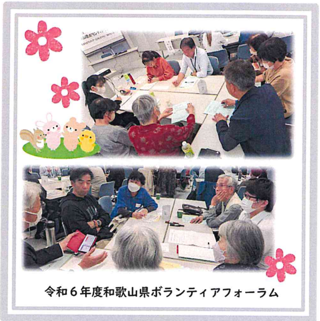
令和6年度和歌山県ボランティアフォーラム