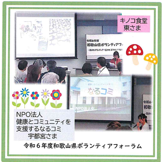
令和6年度和歌山県ボランティアフォーラム