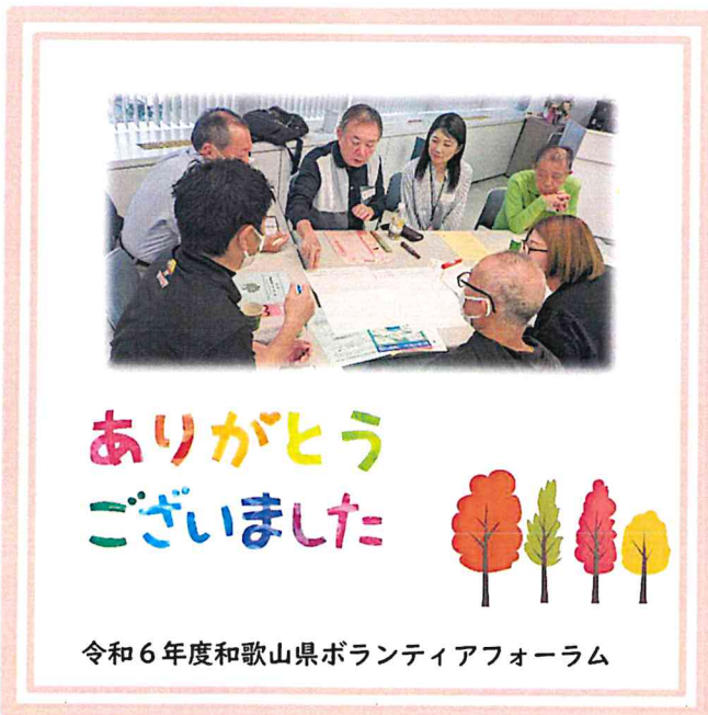
令和6年度和歌山県ボランティアフォーラム