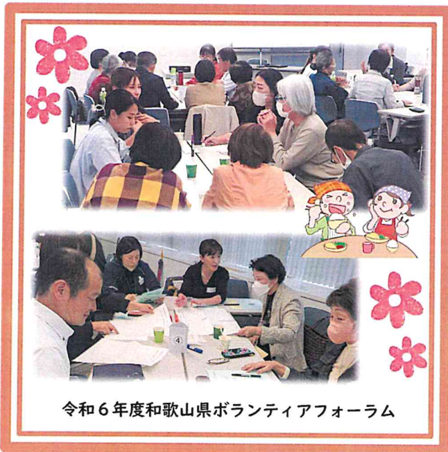
令和6年度和歌山県ボランティアフォーラム